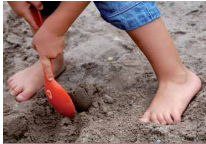
Sparen darf nicht nach dem Rasenmäherprinzip funktionieren. Darmstadt muss eine lebenswerte Stadt bleiben. „Lieber ein Kindergartenplatz mehr, dafür ein Schlagloch später repariert.“

In der Sozialpolitik, die aktuell mehr und mehr Gewicht bekommt, in der Spardebatten allerorts Dauerthema sind und die eines tragfähigen Haushaltskonzepts bedarf, gehen die Sozialdemokraten in Darmstadt den erfolgreich eingeschlagenen Weg weiter. „Radikale Einschnitte, nur um Kosten zu senken, wären hier verheerend. Wir sind auf einem guten Weg, den es fortzusetzen gilt“, so Parteivorsitzender Benz. Projekte wie die Teilnahme am Förderprogramm „Soziale Stadt“, in der Kranichstein und Eberstadt-Süd zu besonderen Förderschwerpunkten geworden sind, müssen eine Zukunft haben. Bei dem Bund-Länder-Programm war Darmstadt mit einem Drittel der Investitionskosten im Boot. Vieles wurde dabei in den vergangenen Jahren bewegt, vom