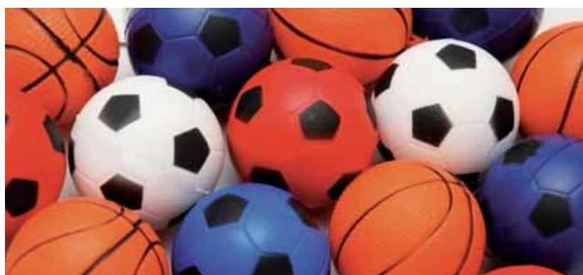
Der Ball liegt bei der Politik, sie ist für bestmögliche Rahmenbedingungen eines bunten Vereinslebens in der Stadt verantwortlich.

«Es ist gar nicht hoch genug anzuerkennen, was hier alles für das Gemeinwohl geleistet wird.»